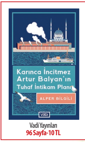
Vadi Yayınları 96 Sayfa-10 TL